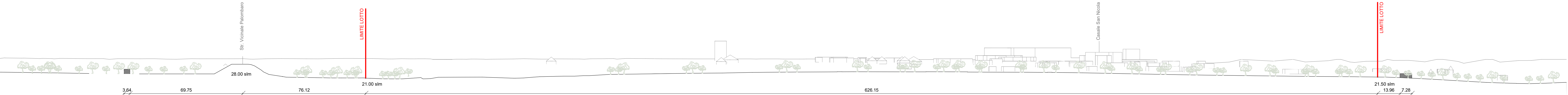
Sezione Territoriale 1 SdF 1:1000