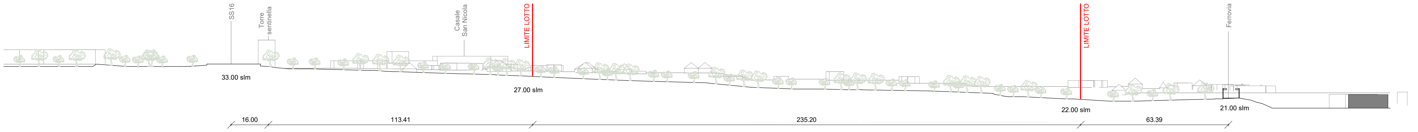
Sezione Territoriale A SdF 1:1000