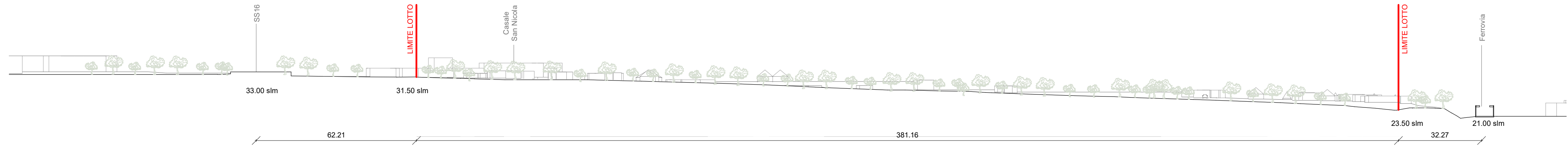
Sezione Territoriale B SdF 1:1000