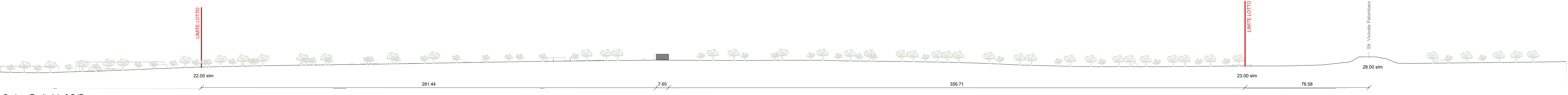
Sezione Territoriale 2 SdF 1:1000