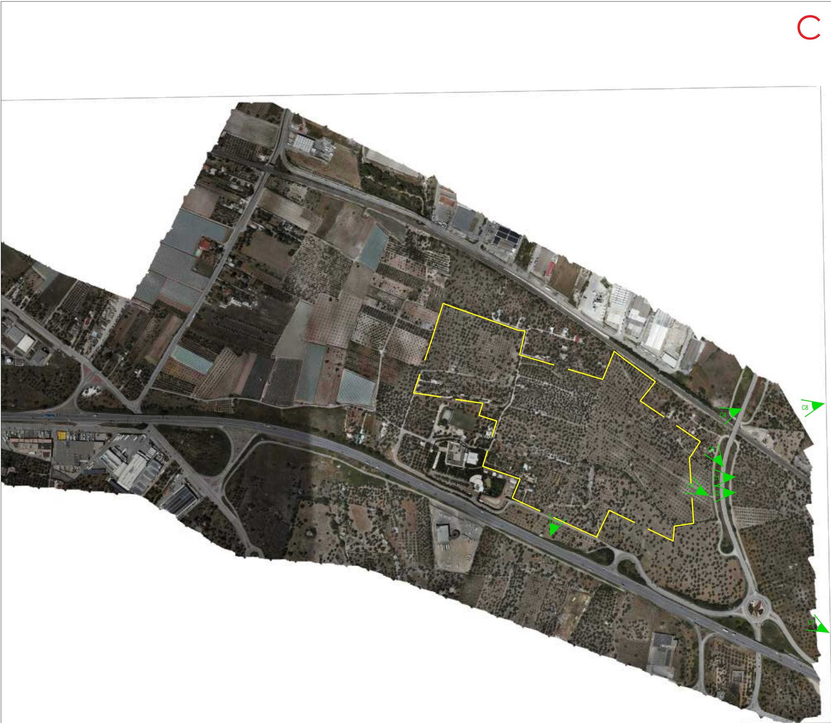
QUADRO "C": CONI VISUALI