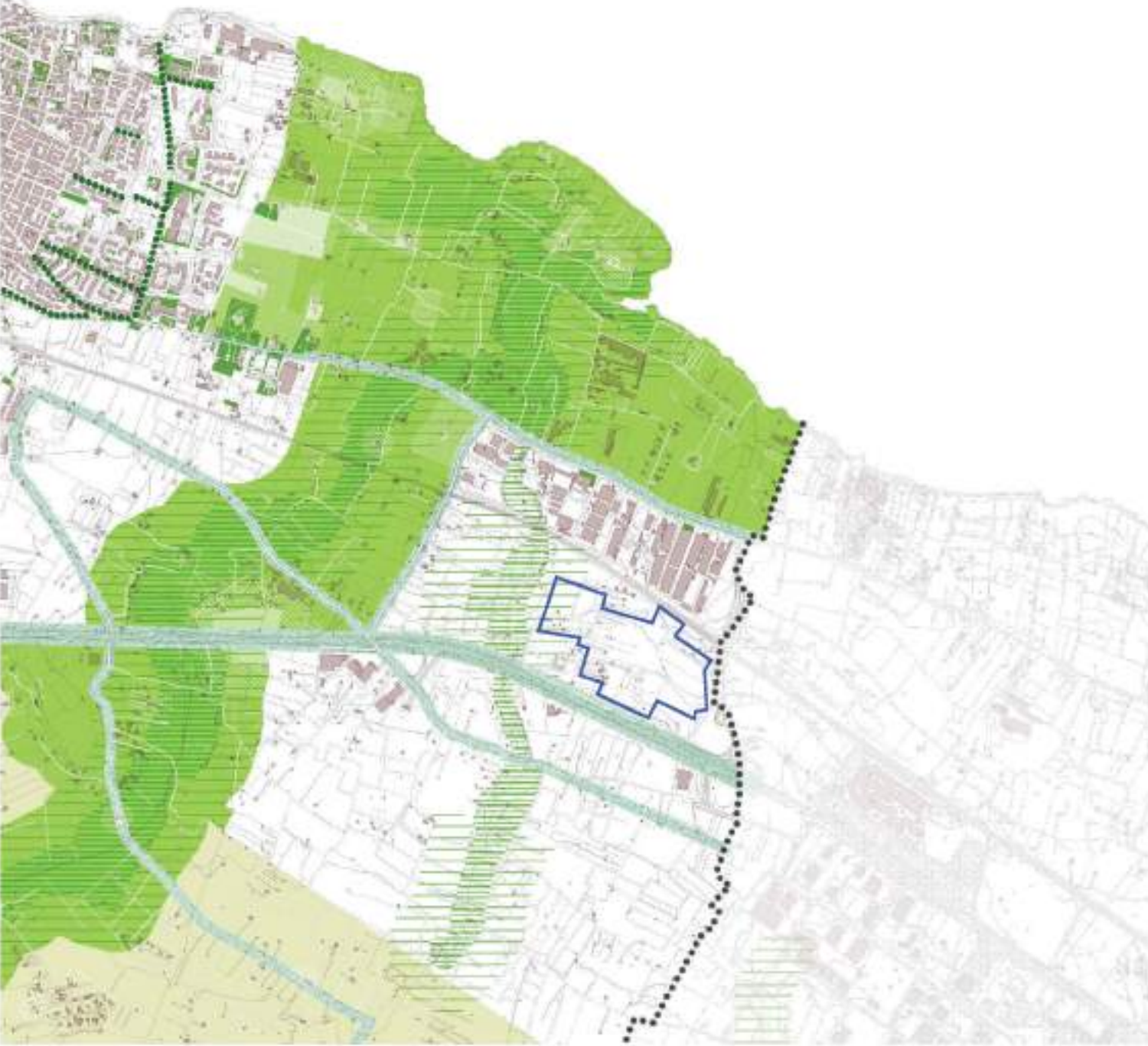
PUG_BSG_SC.5 Carta della rete ecologica totale