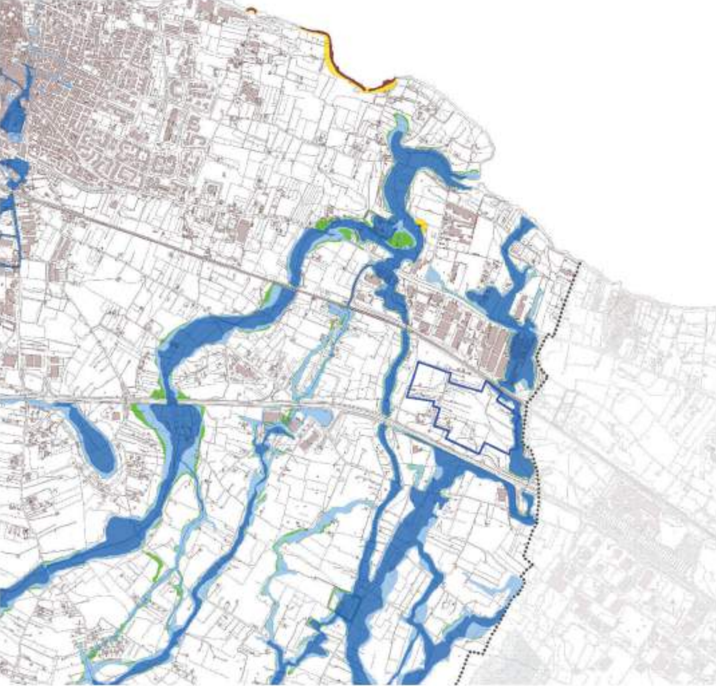
PUG.S.3 Adeguamento al PAI_luglio 2017 fd