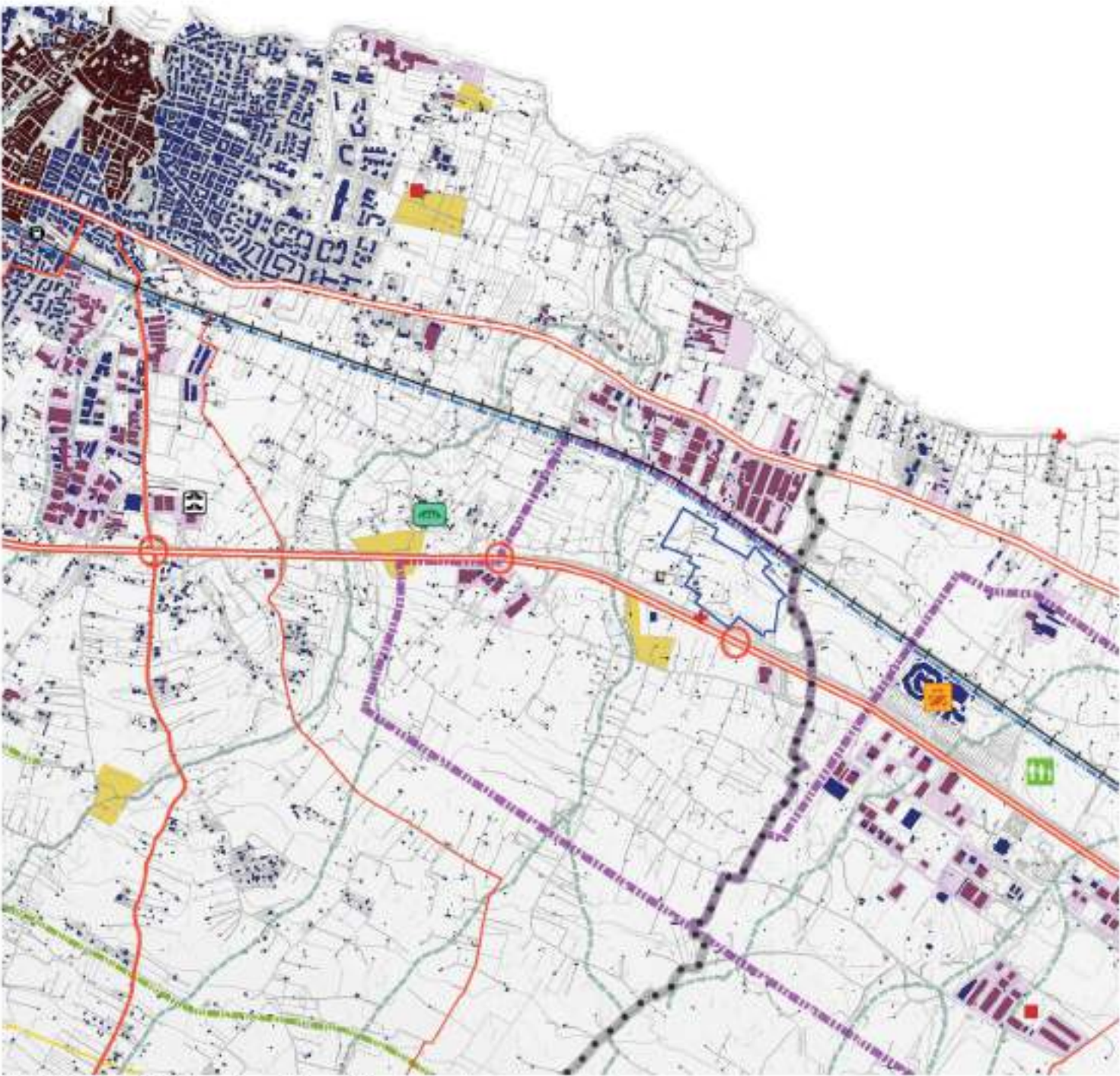
PUG_BSG_SC13 Sistema insediativo e infrastrutturale