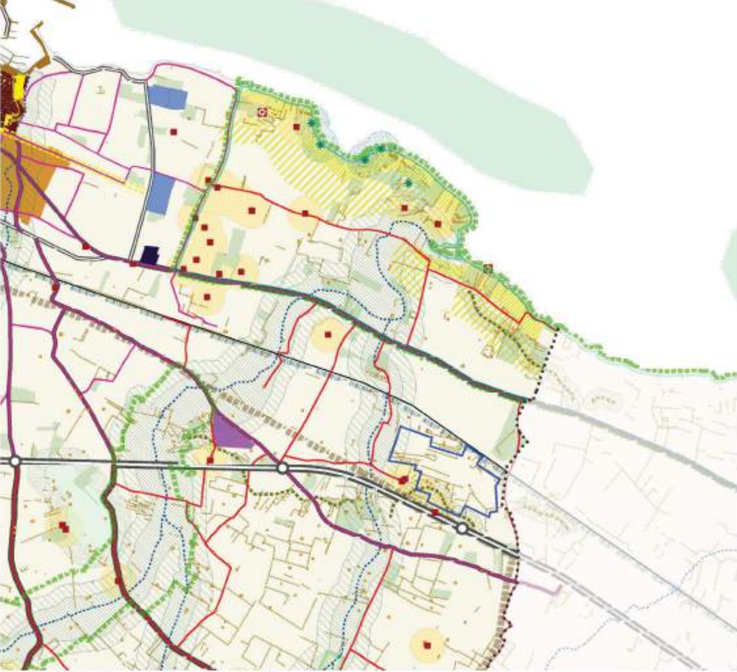
PUG_BSG_QI.1 Carta delle invarianti strutturali