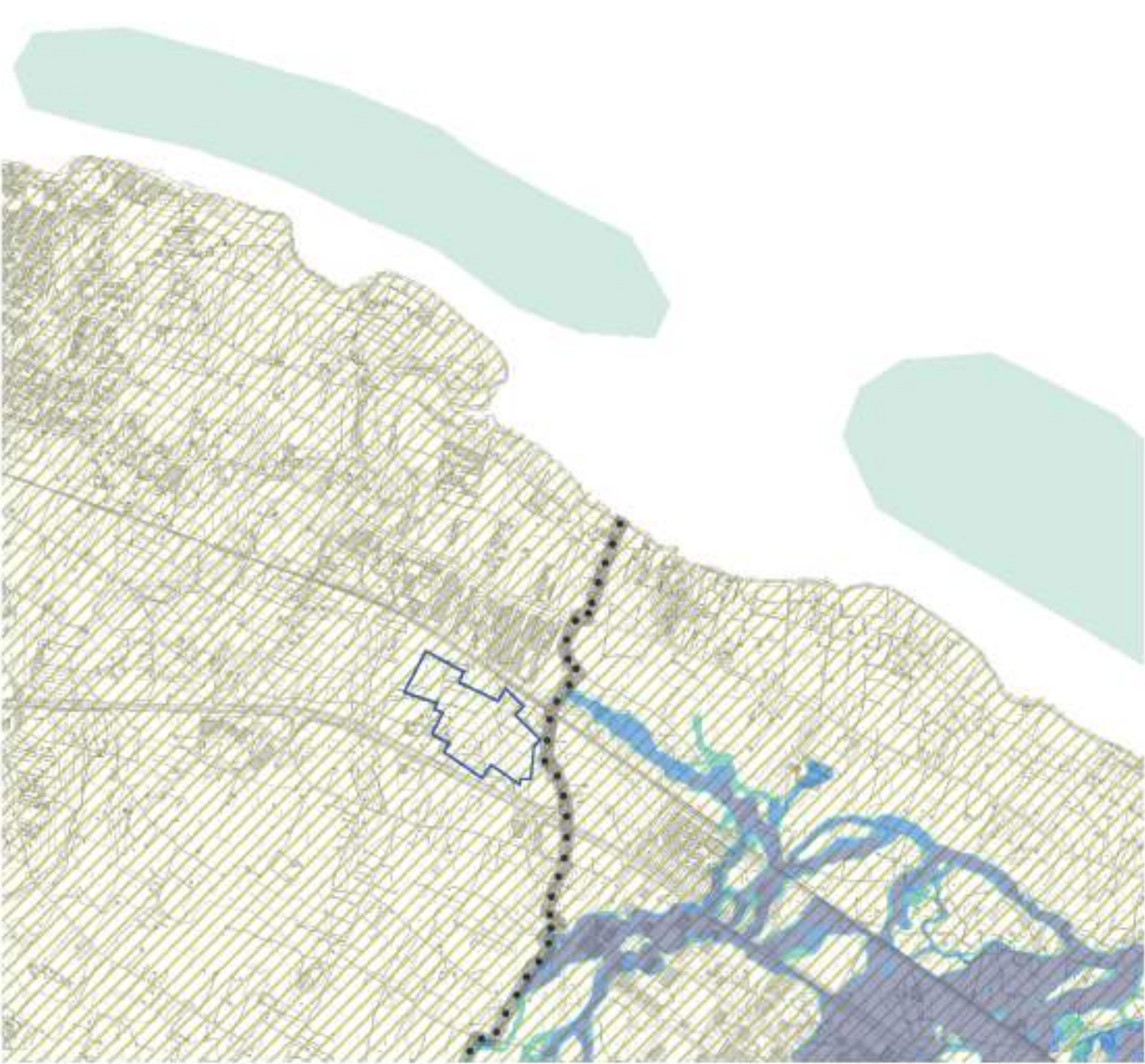
PUG_BSG_SC.1.4 Piani regionali di tutela ambientale _superato dall'adeguamento al PAI 2017