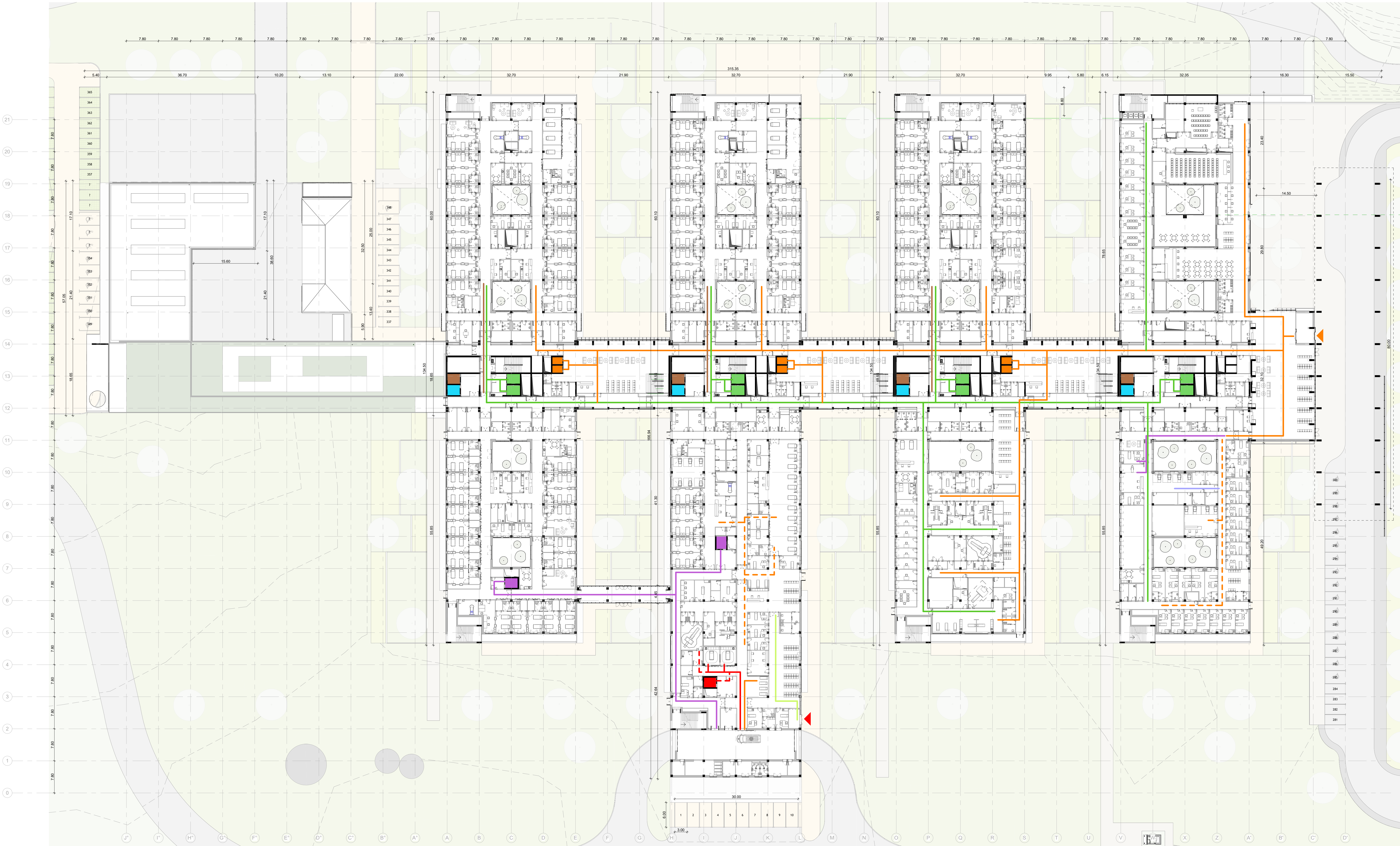
Quadro di unione livello L0 1:350