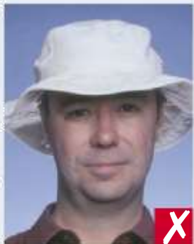
Foto con cappello a falda larga