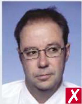
Sguardo rivolto altrove