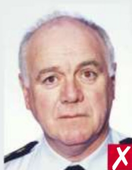
Foto con occhi rossi