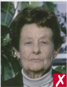
Sfondo della foto inidoneo