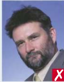
Occhi non in asse orizzontale