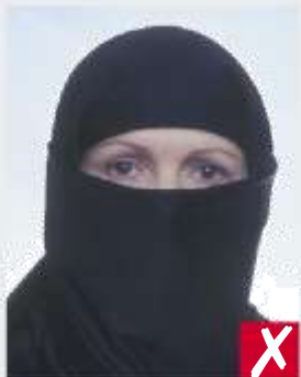
Viso coperto completamente