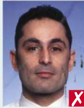
Sporca d'inchiostro o spiegazzata