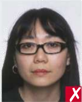
Occhiali con montatura troppo spessa