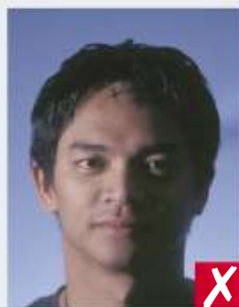
Foto con ombra sul viso