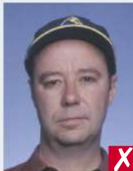
Foto con cappello a visiera