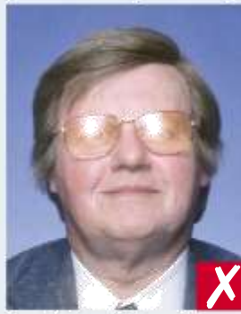
Flash sulle lenti