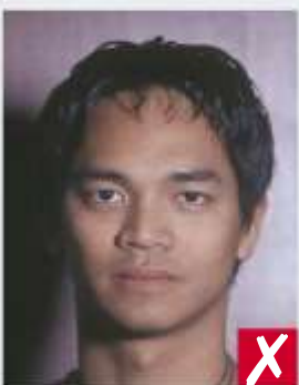
Foto con ombra sullo sfondo