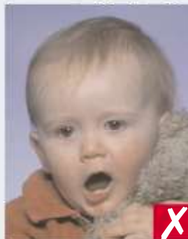
Bimbo con bocca aperta e giocino