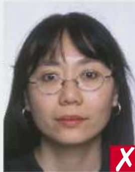
Occhi parzialmente coperti da montatura