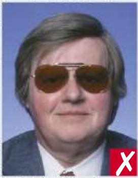
Occhiali con lente scura