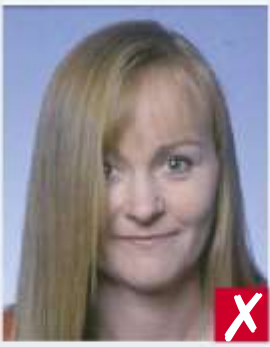
Occhi in parte coperti