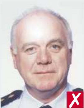
Flash riflesso su pelle