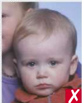
Bimbo e altra persona sullo sfondo