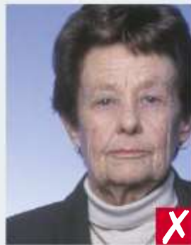
Foto non centrata